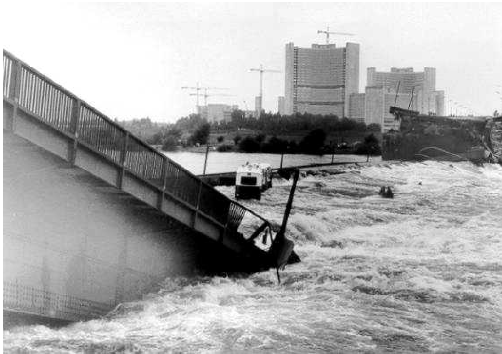
Abb. 1 Eingestürzte Wiener Reichsbrücke