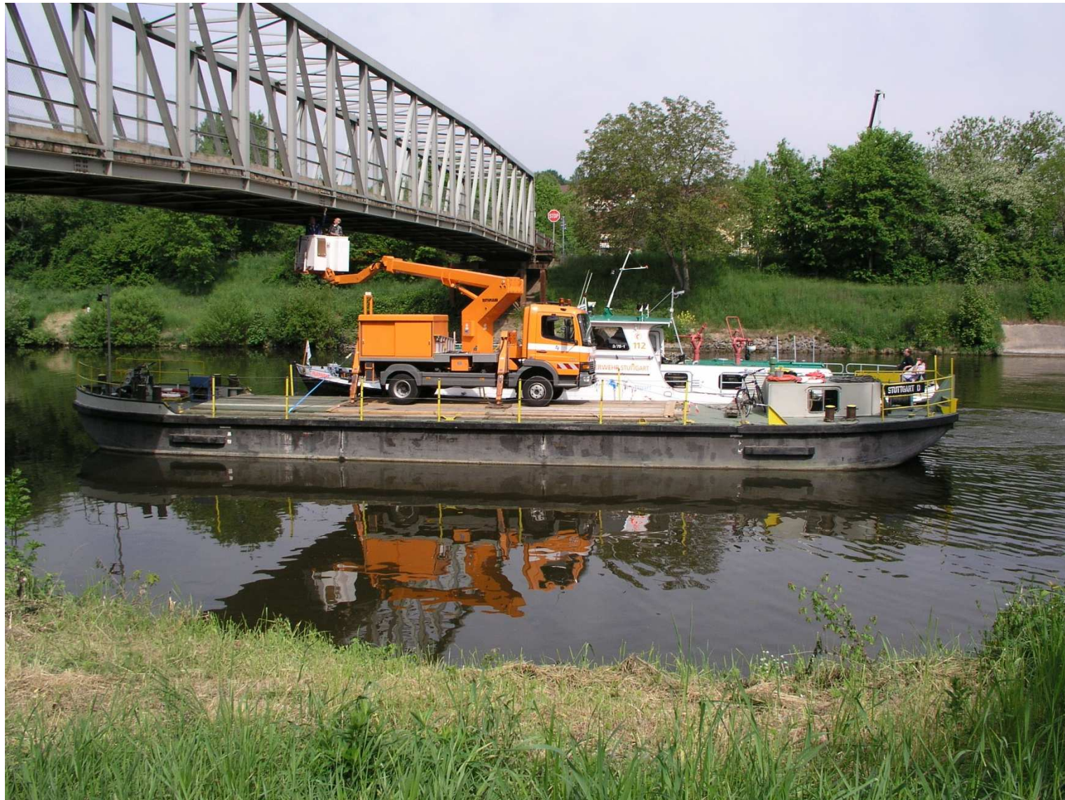
Abb. 5 Kombination Steiger / Schiff, Neckar