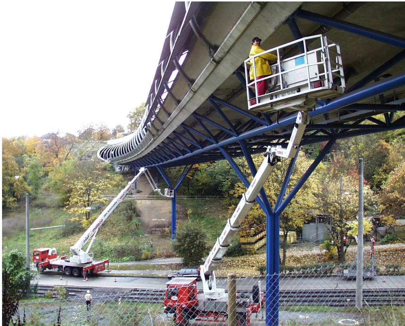
Abb. 4 Brücke Ostumfahrung Vaihingen, Prüfung