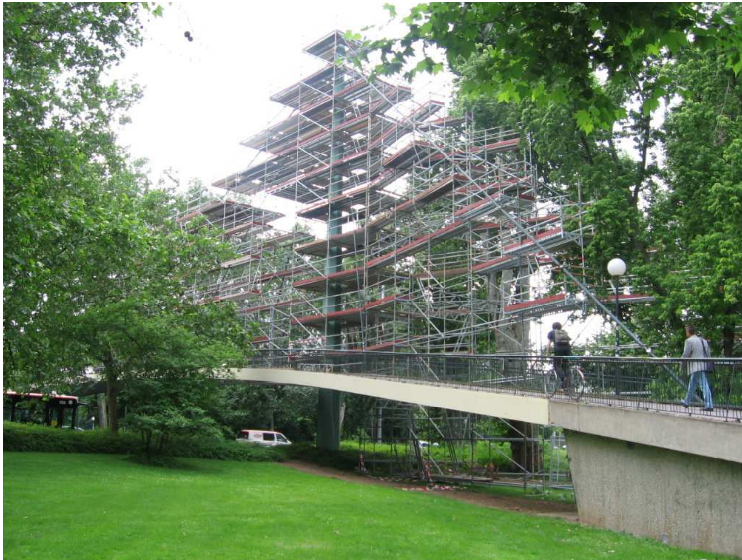
Abb. 11 Einrüstung Kabel und Pylon