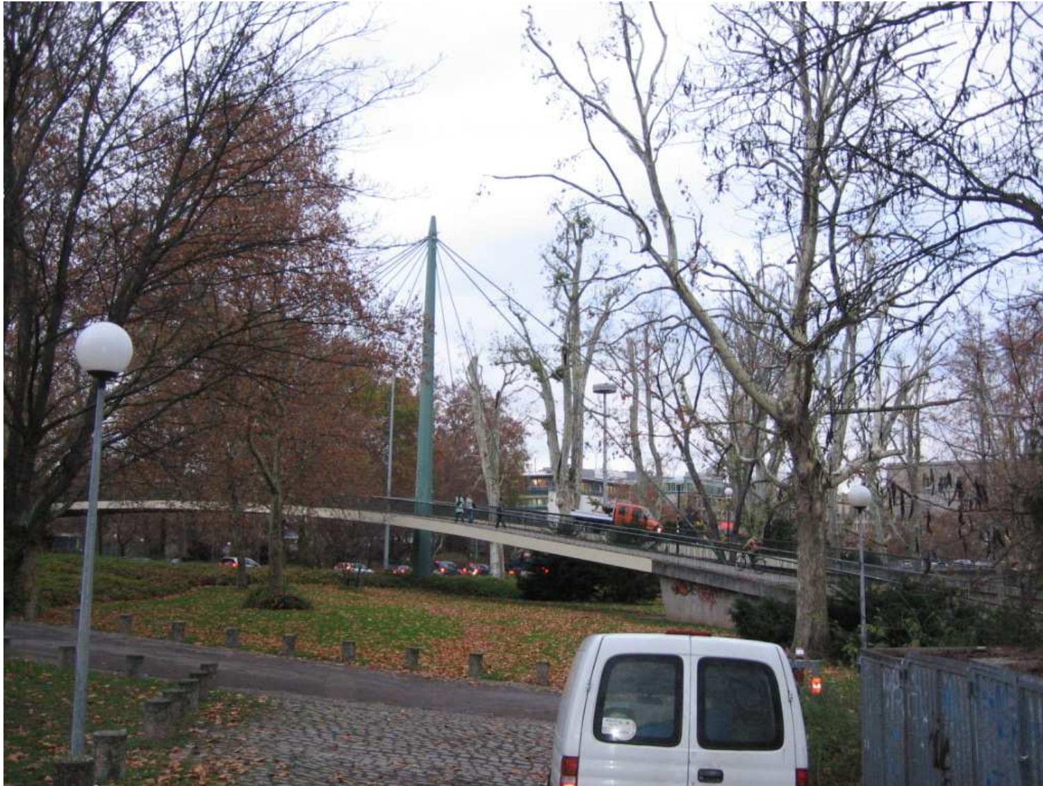
Abb. 9 Ansicht Ferdinand-Leitner-Steg