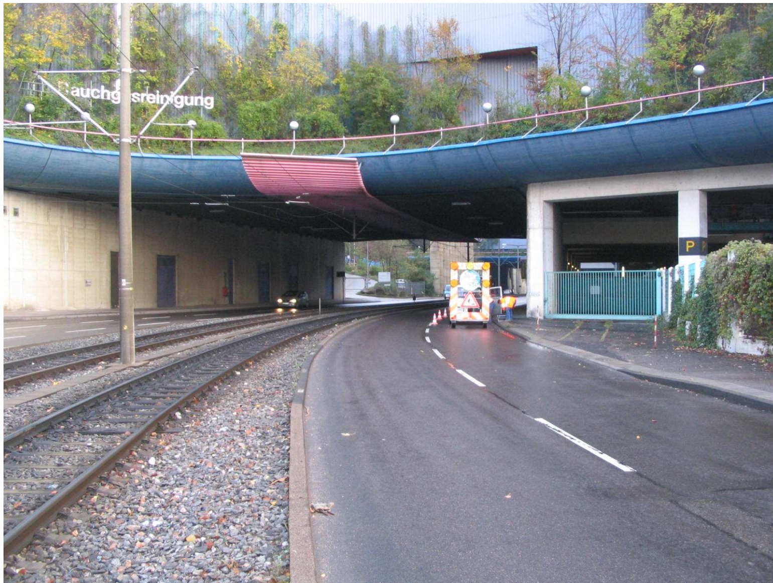
Abb. 6 Privates Bauwerk über Stadtstraße und SSB