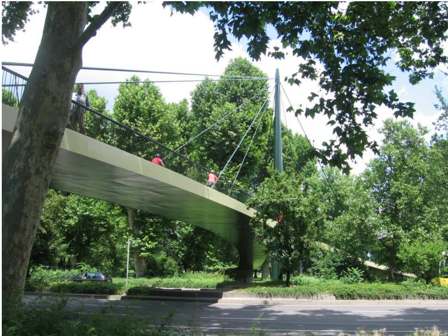
Abb. 12 Bauwerk nach Instandsetzung