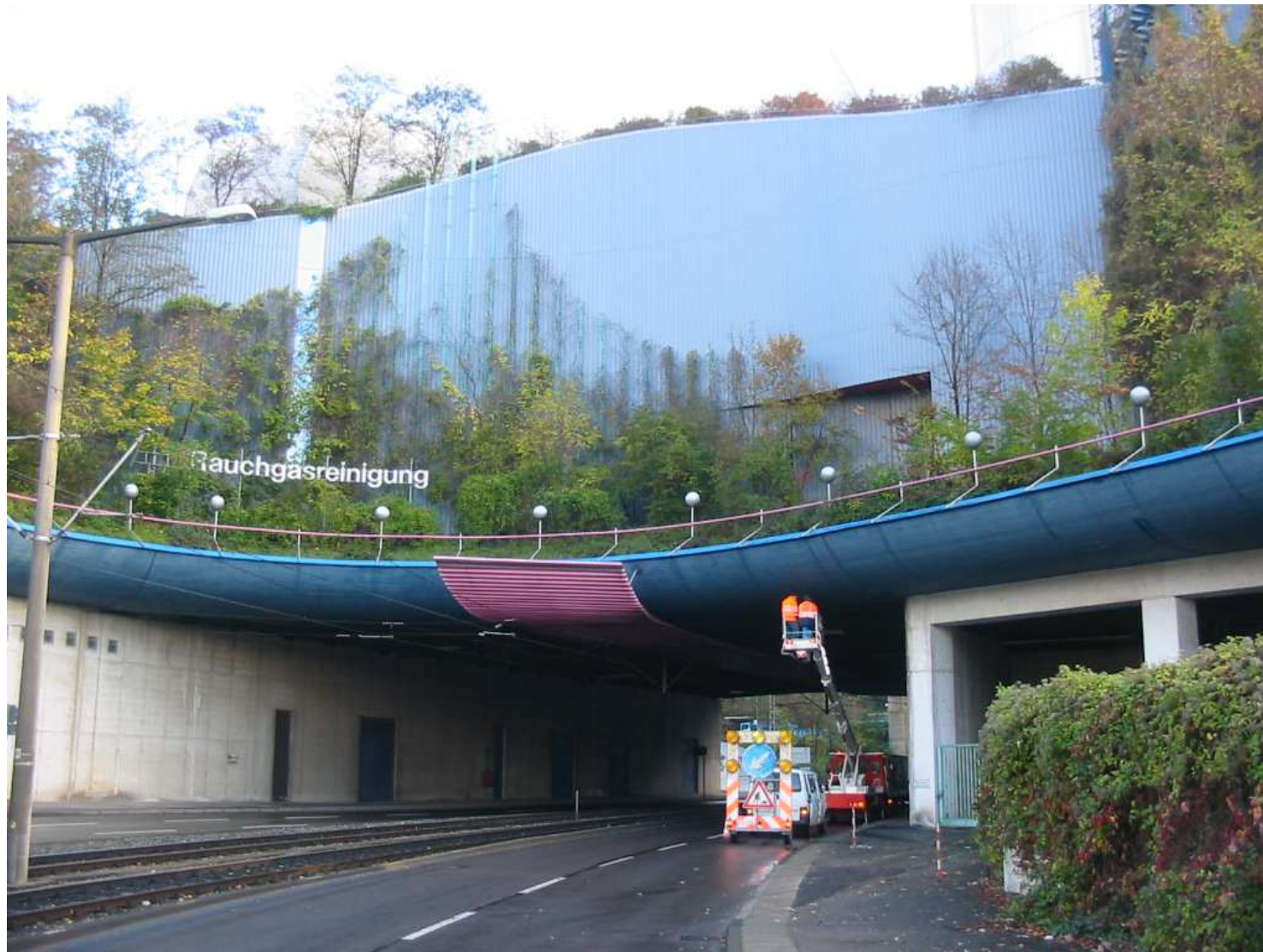
Abb. 7 Hubsteigereinsatz Prüfung Untersicht