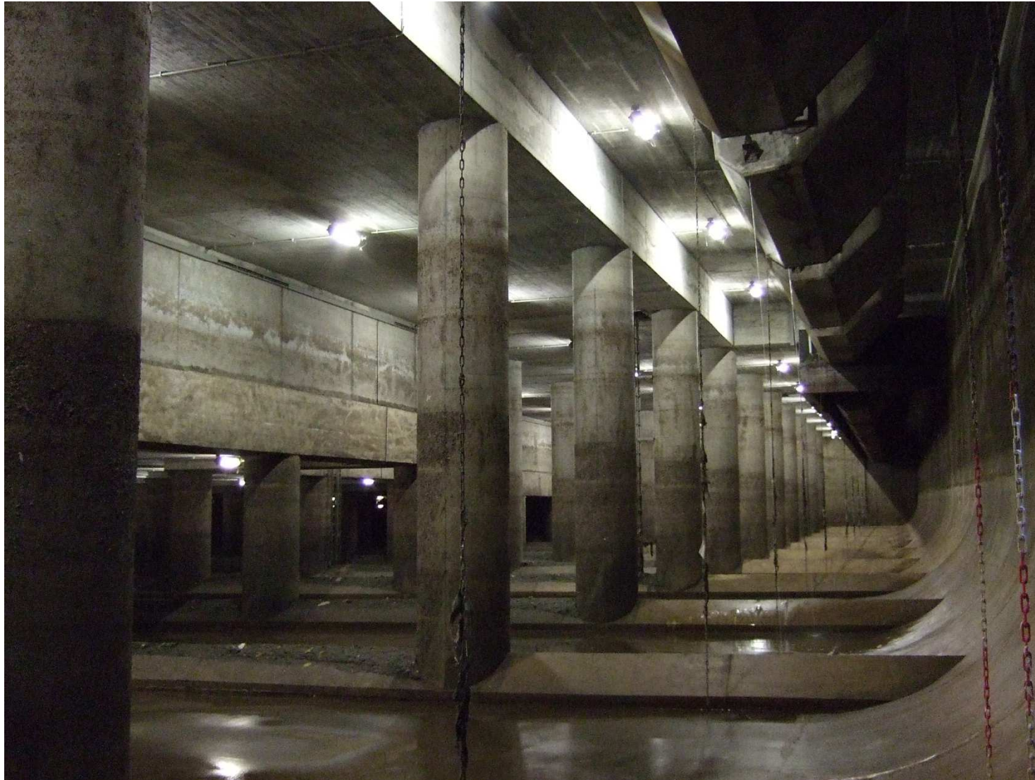
Abb. 3 RÜB Schwanenplatz