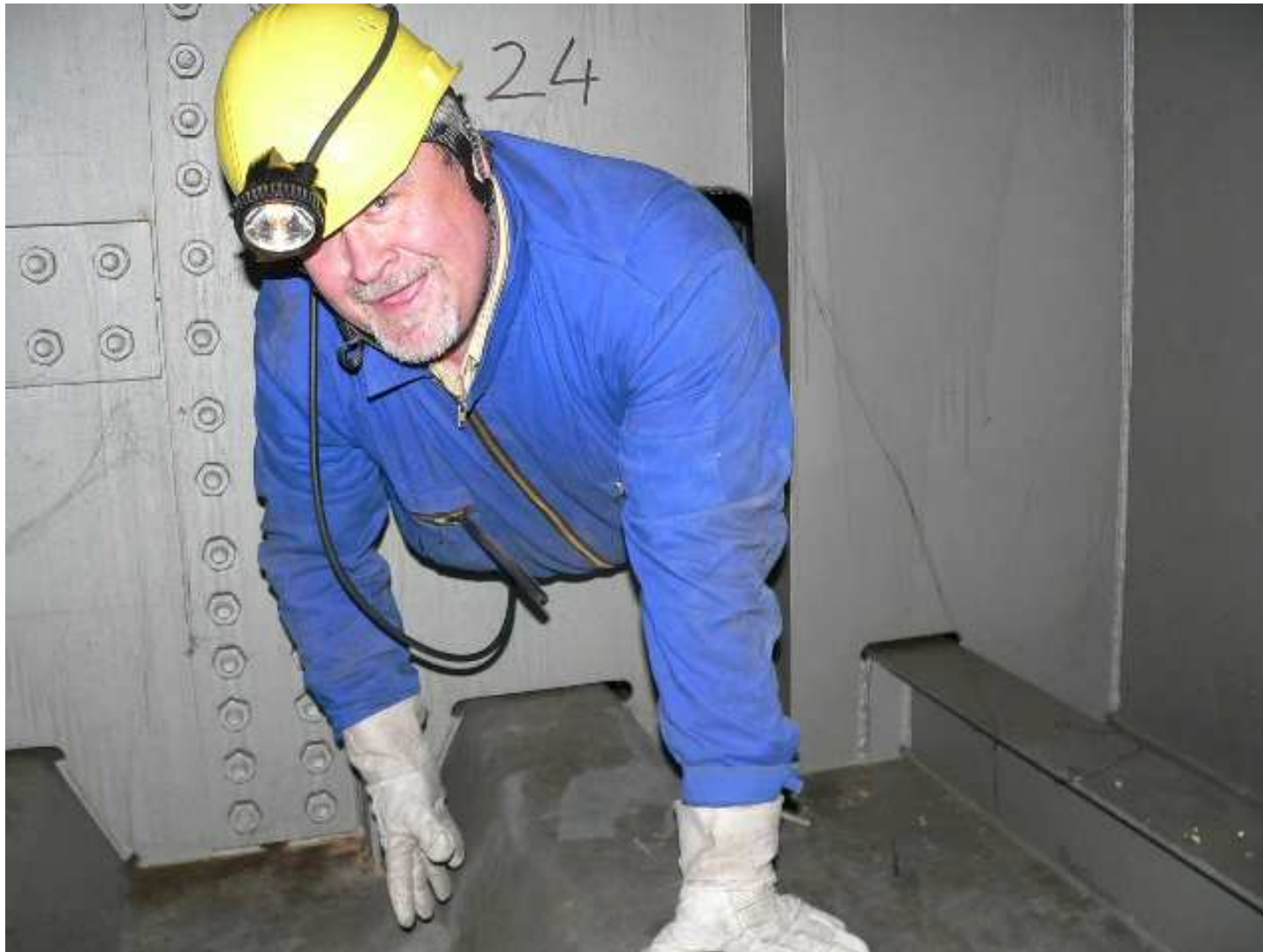
Abb. 2 Bauwerksprüfer im Hohlkasten einer Stahlbrücke