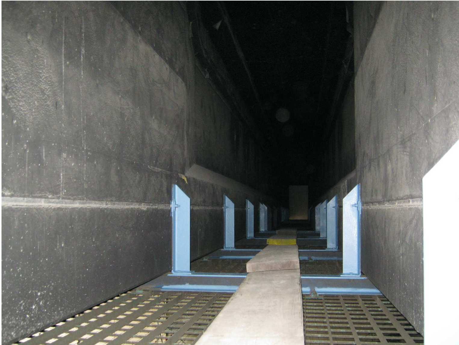
Abb. 8 Gitterrostbelag